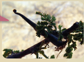
גבנונית השיטים Oxyrachis furva

עש מסדרת הפרפראים שהזחל שלו טווה נרתיק ארוך ומחודד הדומה בצורתו ובצבעו לקוף של שיטה, כך הוא ניזון מעלי וניצני השיטה בהסוואה כמעט מושלמת.