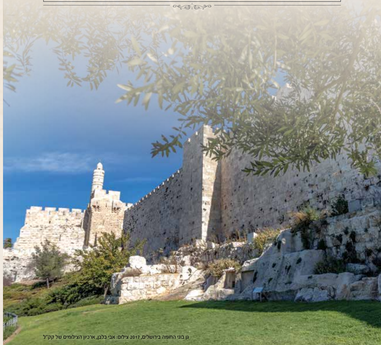
גן בוני החומה בירושלים, 2017

לתמיכה המוסרית והחומרית שמגישים ידידי קק"ל בתפוצות יש חשיבות עצומה. בזכותם מצליחה קק"ל להכשיר את הארץ למען הדורות הבאים. מאגרי מים, פארקים אזוריים, חניונים, שבילי טיול ברגל וגנים עירוניים כגון הגן שבצילום (תרומת JNF קנדה) ספוגים כולם באהבת ישראל של ידידי קק"ל.