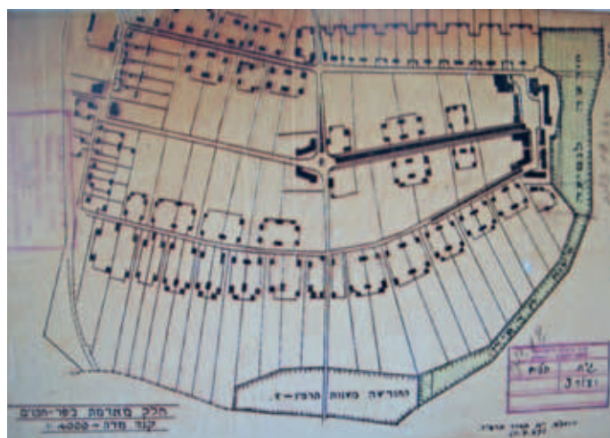
תמונה 7: תכנון מול ביצוע. תכנון הייעור של ק"ל תרפ"ו-תרפ"ח (1926-1928). JNF forest plan at Hittim 1926-1927 (Aerial photograph 2005).