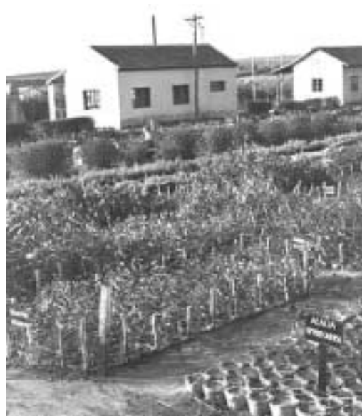
משתלת אילנות 1950