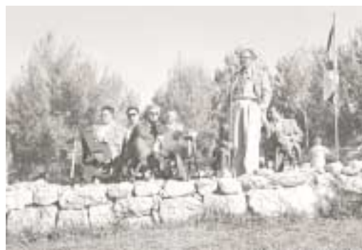
טקס קליטתם בקק"ל של עובדי אגף הייעור הממשלתי 1.1.1960. נואם: י' ויץ.

השנים שחלפו מאז. כבר ב-1960 התנהלה חלופת מכתבים בנושא 52, 53 . לאחר מכן עלה הנושא בשנת 1968 על-ידי היועץ המשפטי לממשלה 54 . מעת שהפסיק אגף הייעור הממשלתי לפעול, ממונים עובדי קק"ל כפקידי יערות. עניין זה עלה בעתירה של 'אדם טבע ודין' ואחרים לבג"ץ 55 , בהתאם למה שנקבע שם ועל מנת להסדיר בעיות ניגוד עניינים נתמנה גם עובד משרד החקלאות לפקיד היערות. בעניין זה קיימות עדיין מחלוקות בלתי פתורות. 7. ביקורת המדינה על מחלקת הייעור. לא יושם חוק מבקר המדינה, לפיו גוף המנהל נכסי מדינה חייב בביקורת: ניהול היערות הוא ניהול בפועל של מקרקעי מדינה. לא נמצא המשך למכתב מבקר המדינה מדצמבר 1959 בעניין זה.