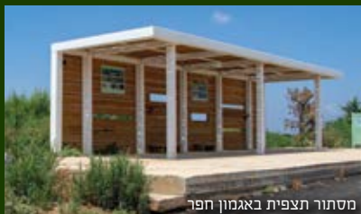
מסתור תצפית באגמון חפר