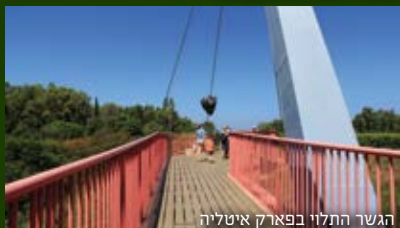
הגשר התלוי בפארק איטליה