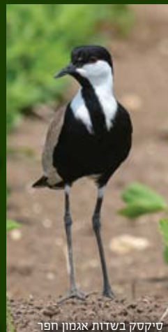
טיקס בשדות אגמון חפר