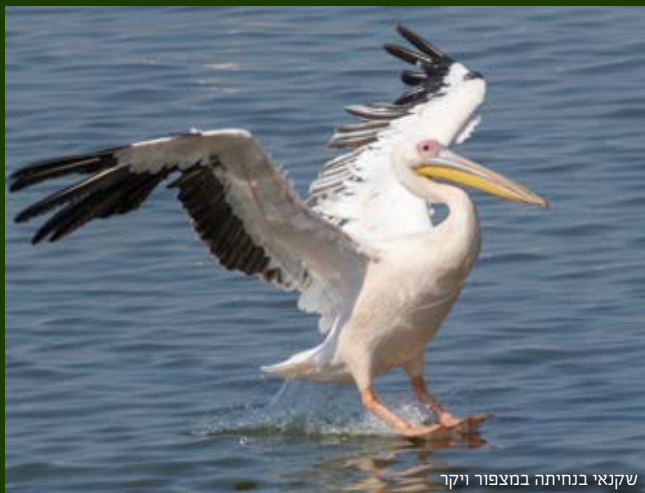
שקנאי בנחיתה במצפור ויקר

בקטע נחל לדוגמה נמצאים שני גשרים. הראשון שבהם הוא "גשר