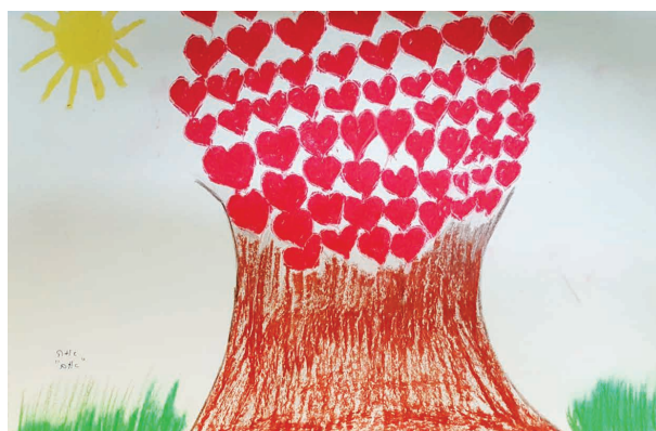
עץ אלון התבור בשם "אום" (אמא) שצויר כבסיס לשיתוף בקבוצה בנושא הקשר עם אם קשישה ציור: אחת המשתתפות