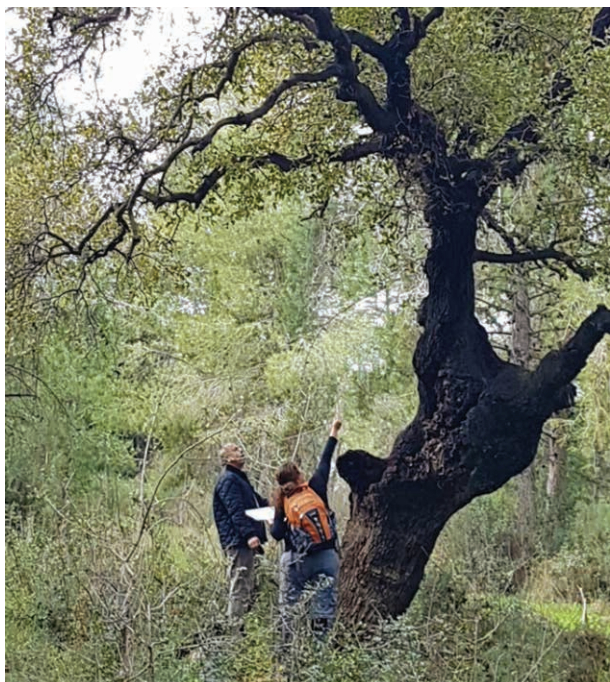
חברי הקבוצה ממפים וסוקרים את מצב בריאות עצי המורשת ביער עירון