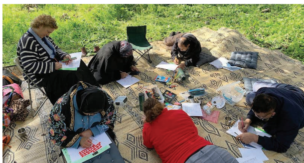
חברי הקבוצה מציירים את העצים שמופו ונסקרו כבסיס לשיתוף אישי בקבוצה של תחושות שעלו עקב המפגש עם העצים

פורת י זאהר א. 2022. סקר קהילתי של עצי תפארת בחרבת עבאס שביער עירון. מחלקת אקולוגיה באגף הייעור ואזור מנשה שרון, קק"ל.