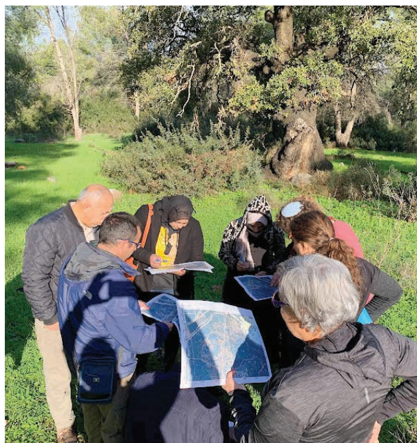
מתן הסבר לקבוצה לקראת ביצוע מיפוי וסקר בריאות העצים