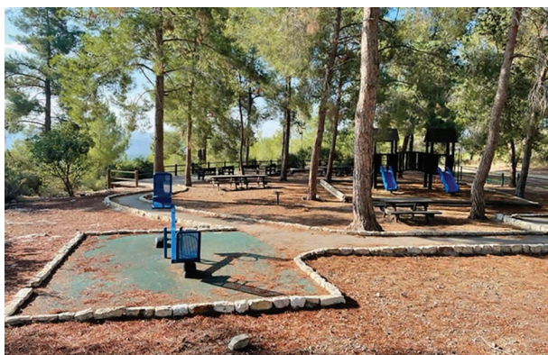
תצפית ביער אשתאול