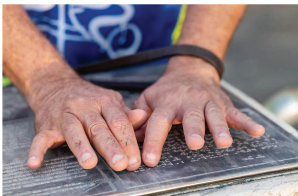
שלט בתבליט לכבדי ראייה, חניון העיוורים, יער בן שמן, 2021