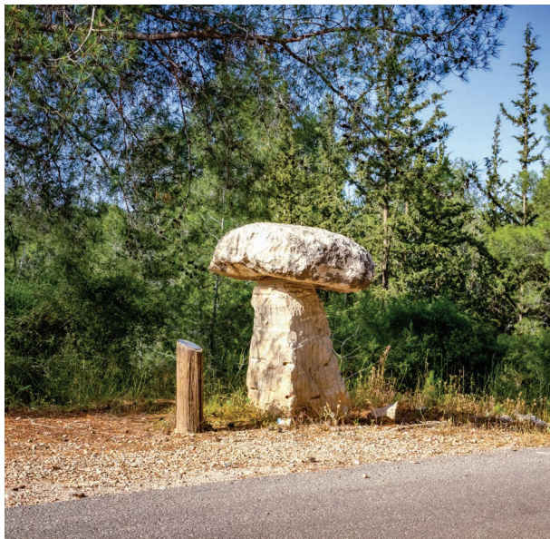
דרך הפסלים, יער צרעה, פסל הפטרייה, 2020