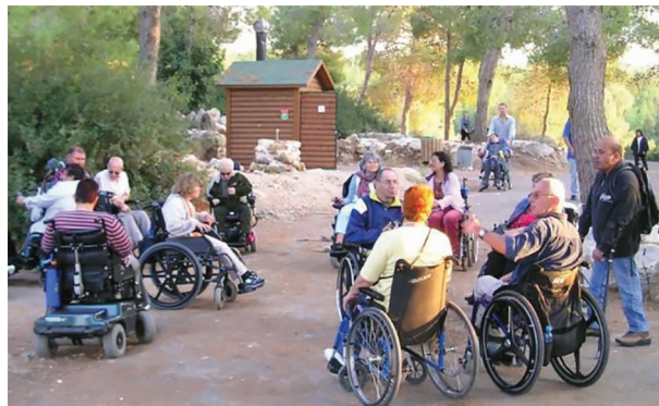
קבוצת מיקוד של אנשים עם מוגבלויות, יער חרובית, העשור הראשון של המאה ה-21