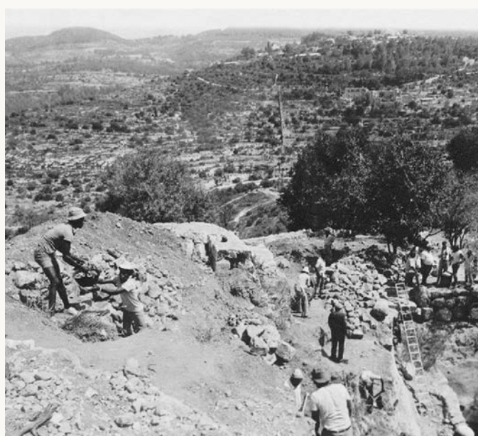
בני נוער משקמים את המדרגות החקלאיות, 1986