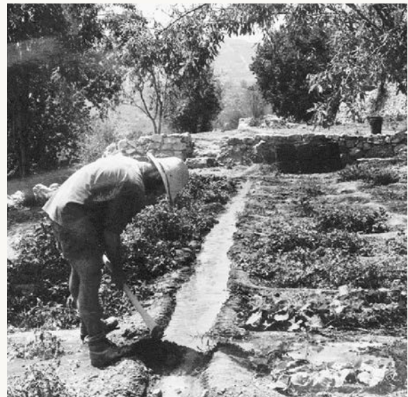
עובד בסטף, 1987