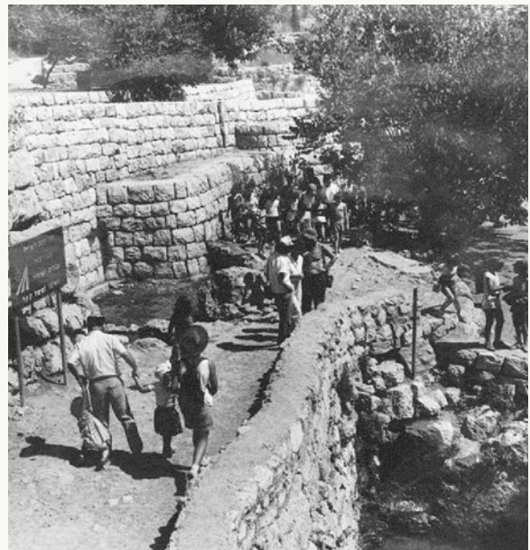
מטיילים בסטף, 1989