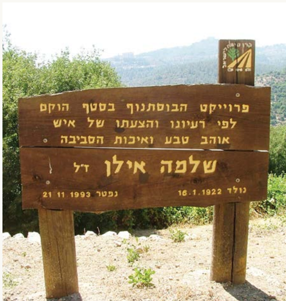
פרויקט הבוסתנוף על שם שלמה אילן, 2007