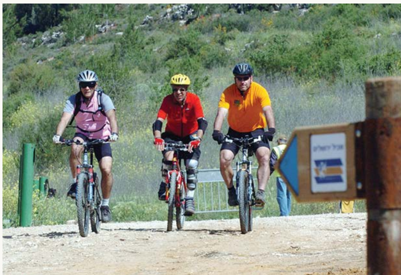
רוכבי אופניים בהר איתן, 2020

אנחנו עוברים לגור בקיבוץ קריית ענבים, ועוברים קודם תקופת הסתגלות בנטף. קריית ענבים זה קיבוץ מופרט, אנחנו מצאנו שם פינה. אני הגעתי לכאן בגיל 26, ואנחנו התפנקנו כאן מבחינת לחיות בטבע.