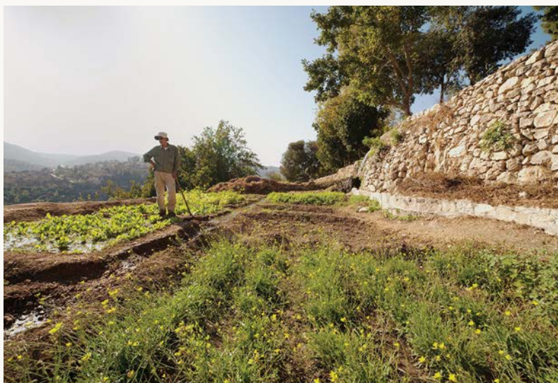
טרסה חקלאית בסטף, אוקטובר 2020