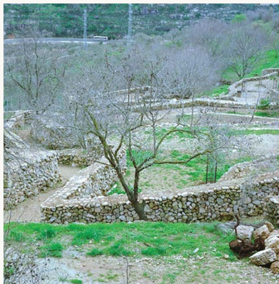
מדרגות חקלאיות ושבילי הליכה בסטף, 1995