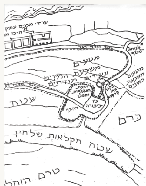
תוכנית הסטף ששרטט שמחה פינקלמן