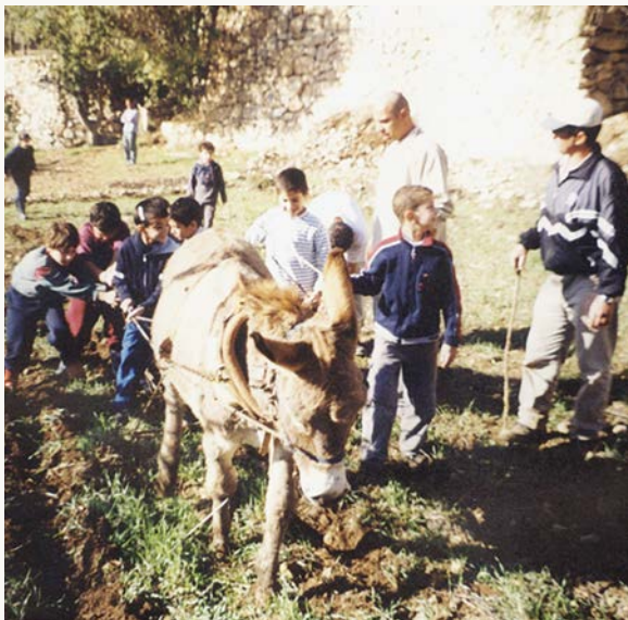
חריש עם חמור בסטף, 2003

המים זרמו אחרי שניקינו את הבריכות. לפני כן הן היו מלאות בוץ. הרעיון היה לקחת טוריה ולהתחיל לעבוד עם מחשבה. המחשבה נוצרה בסינרגיה נהדרת ביני לבין חנוך. לא רק איך קמים בבוקר ועודרים עם הטוריה, אלא מה אנחנו רוצים מהמקום הזה. בקק"ל חשבו שנעבוד פה שנה–שנתיים. הייתה מחשבה שנתפרנס מהירקות שאנחנו מגדלים, אפילו הייתה מחשבה שנקים כאן קיוסק. אמרו לנו: "אנחנו לא רוצים לממן אתכם, אנחנו רוצים שתחיו באופן עצמאי". אני חייב לציין שמדינת ישראל של שנות ה־80 הייתה מדינה של