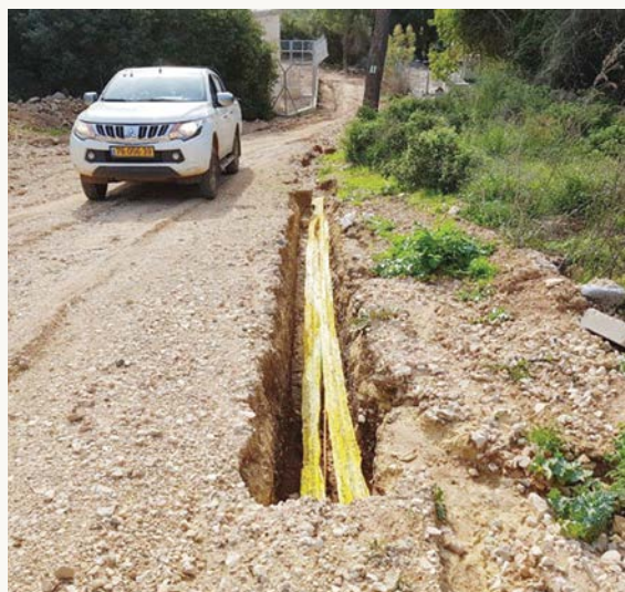
איור 3: תמונת תוואי קו גז בדרך בורמה, יער אשתאול