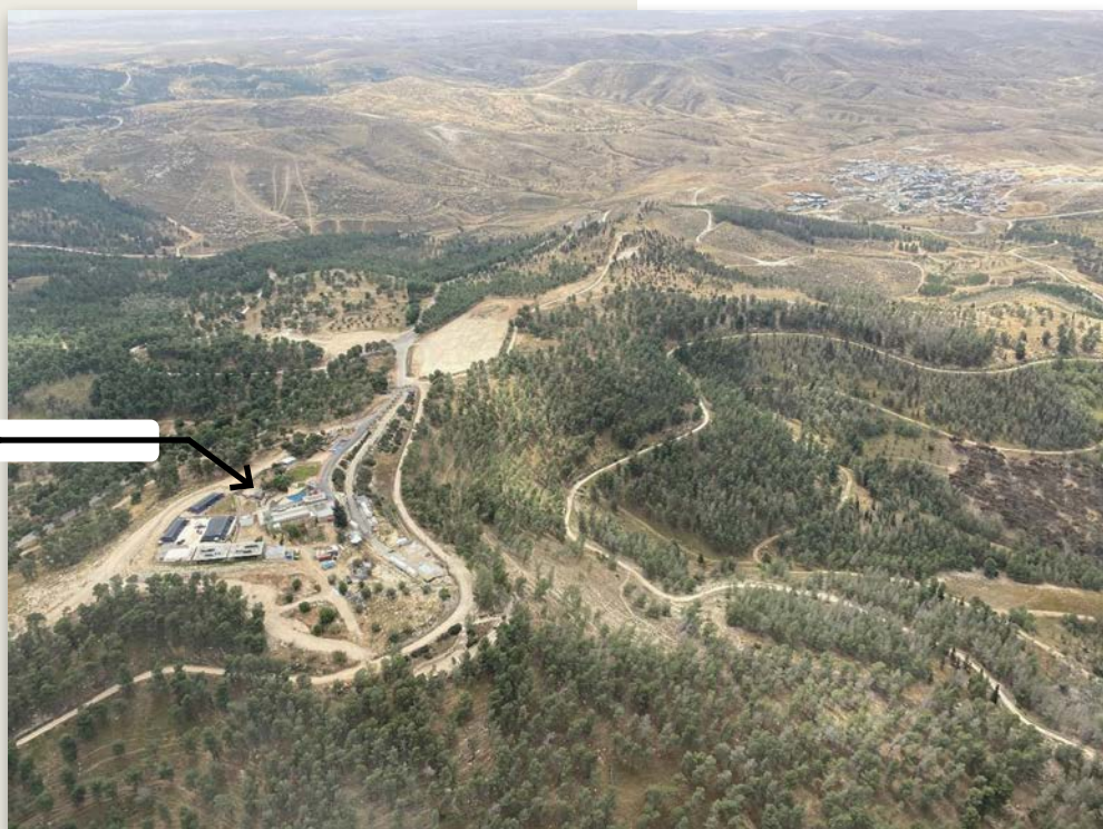
תצלום אווירי של יער יתיר, מרכז השדה החינוכי ומצודת היערנים (מסומנת בחץ), אפריל 2021.