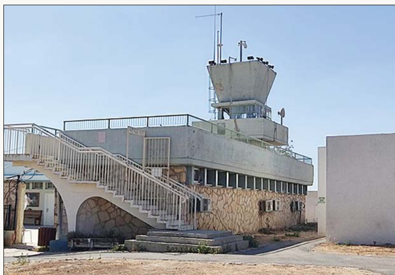
מצודת היערנים