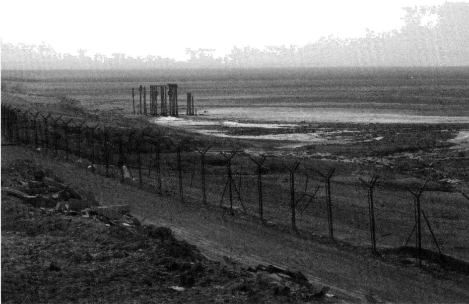
גדר הביטחון בבקעה. החסמים העיקריים לפיתוח הבקעה הם מדיניים-ביטחוניים.

גם קווי חשמל משותפים למדינות האזור. כבר כיום מחוברת העיר יריחו, בתיאום עם ישראל, לקווי החשמל של ממלכת ירדן. גילויי הגז בחופי ישראל ועזה יכולים להביא בעתיד לבניין צינורות גז מהחופים לבקעה ולירדן. מפעלי התחבורה והלוגיסטיקה עשויים לספק אלפי מקומות עבודה.