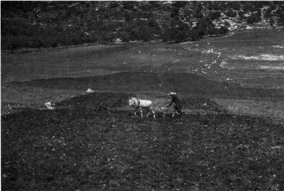
פלאח פלסטיני חורש באדמות במרחב ההררי המערבי של הבקעה. רובם של כ־42 אלף הפלסטינים שחיים בבקעה מתפרנסים מחקלאות.

משכם. הפלסטינים מגדלים בעיקר בננות וירקות וכן תמרים ומעט פרי הדר – מנדרינות ופומלות.