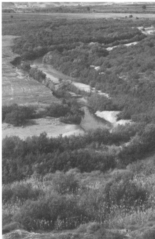
"נהר" הירדן. נהר הירדן היבש מסמל את הבעיה המרכזית של כל תוכניות מימוש הפוטנציאל הקרקעי הגדול של בקעת הירדן.

אמנם מעולם לא היה שימוש במי הירדן כדי להשקות את הבקעה, אלא נעשה שימוש בעיקר במי מעיינות וגם בקידוחים. הזרימה בירדן קטנה בשל הפעלת המוביל הארצי ולא בשל משיכת מים מזרם לכינרת. עם זאת קיים מחסור ניכר במים באזור, והדרך היחידה לפתח את האזור היא באמצעות הובלת מים מבחוץ. קבוצת Aix מצאה שהדרך היחידה להביא מים לבקעה היא באמצעות הובלתם מאזורים אחרים. ההובלה תיעשה באמצעות צנרת מים ישראלית או ירדנית במסגרת תוספת כמויות מים גדולות לכל האזור, שמקורם במתקני התפלה בחוף הים התיכון.